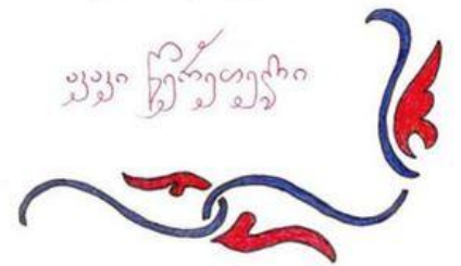
კალიგრაფი: დავით მაისურაძე